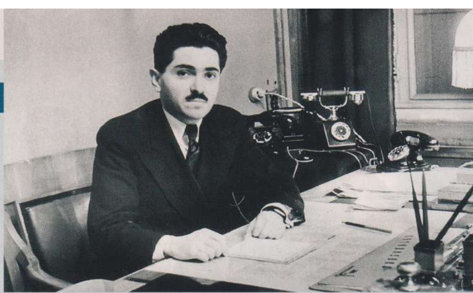
ГЛАВКОВ / РОСИНФОМ