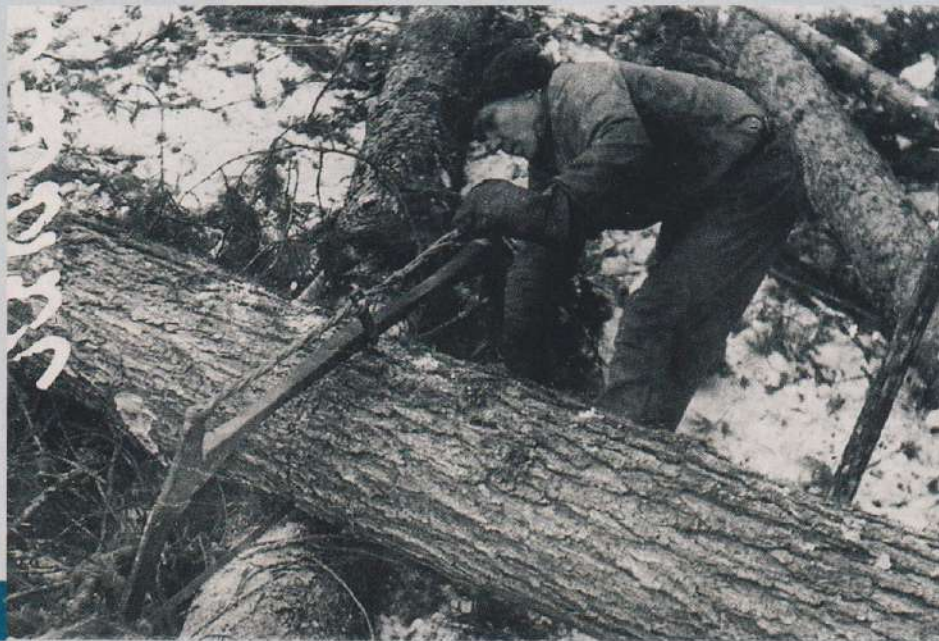
ГЛАВКОВ / РОСИНФОМ

1. Падение грузооборота железных дорог с началом войны сопровождалось пропорциональным ростом оборота аппаратчиков в структурах Наркомпути