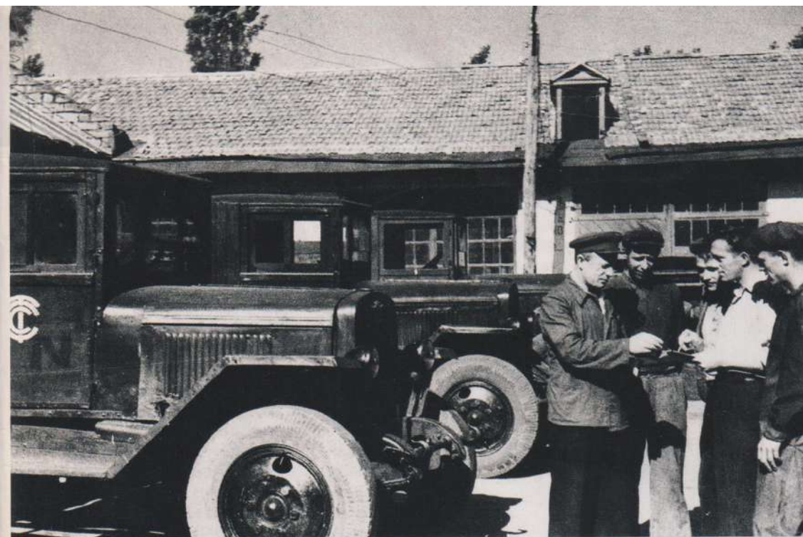
Г. КОМАНД. ГРОСИНСКИМ